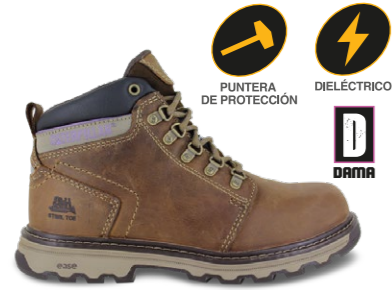
MOD. ELLIE ST P90783