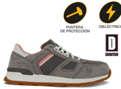
MOD. WOODWARD P91013 NUEVO