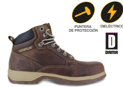
MOD. KITSON SRX ST P304088