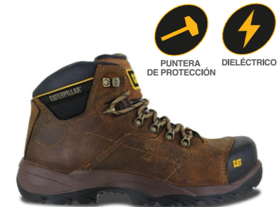
MOD. COOLANT ST P711840