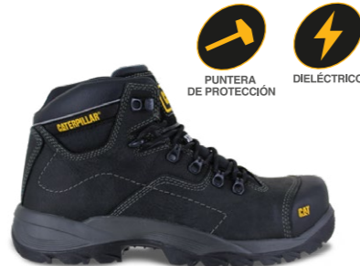
MOD. COOLANT ST P711841