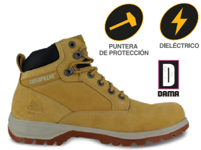
MOD. KITSON SRX ST P304087