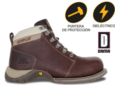
MOD. CARLIE ST P89674