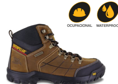
MOD. THRESHOLD WP P723448