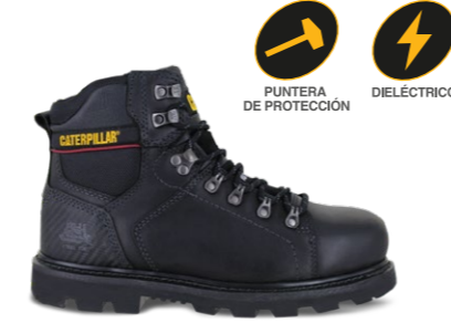
MOD. ALASKA 2.0 ST P90864